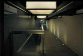
SWIMMING POOL IMAGE

在清泉中浮沉，如葉的雕刻中瀟灑出帷幕，弧狀重覆的穹頂映照如葉的孤，片片於水中，究竟岸上或水中世界為唯一的真實？